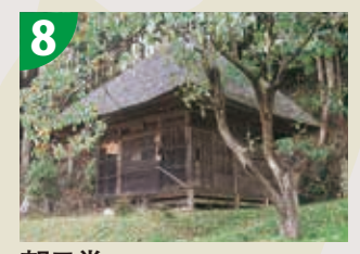
8 朝日堂 (茂木町指定有形文化財)