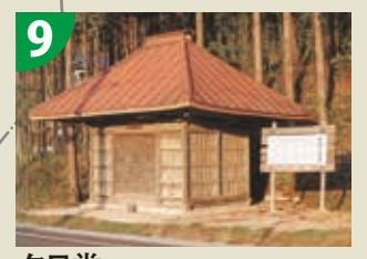
9 夕日堂 (茂木町指定有形文化財)