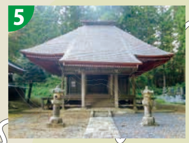
5 小貫観音堂 (栃木県指定有形文化財) ▷ 木造十一面観音立像