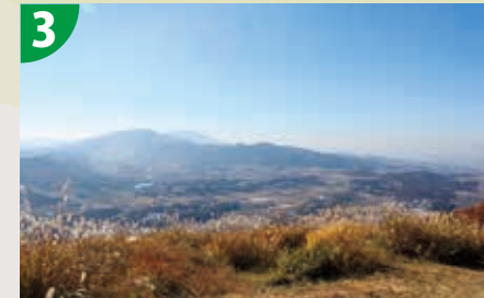
高峯山頂からの眺望