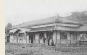
茂木停車場(建設当時)

茂木駅は、大正9年12月15日に開業しました。建設当初から主要駅のひとつで、本館は瓦葺きで内外共に淡緑色のペンキ塗り、事務室等も最新式の構造法をもって造られました。