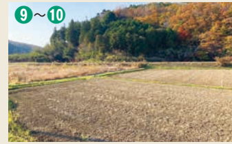
小井戸切通し(其の1)～先