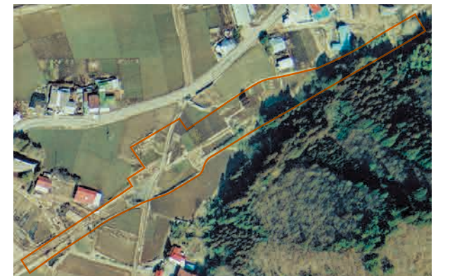
1/8千 空中写真「常陸大宮」(昭和50年2月12日撮影)×2.5 下野中川停車場構内イメージ

茂木駅から5.6km付近に、下野中川駅は建設されました。現在は一部畑になっていますが、敷地の形状から、規模の大きな駅だったと推測されます。